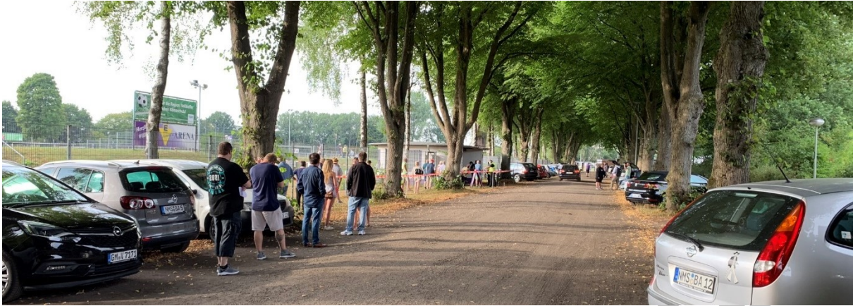
Abbildung 5: Wartebereich vor der Kasse