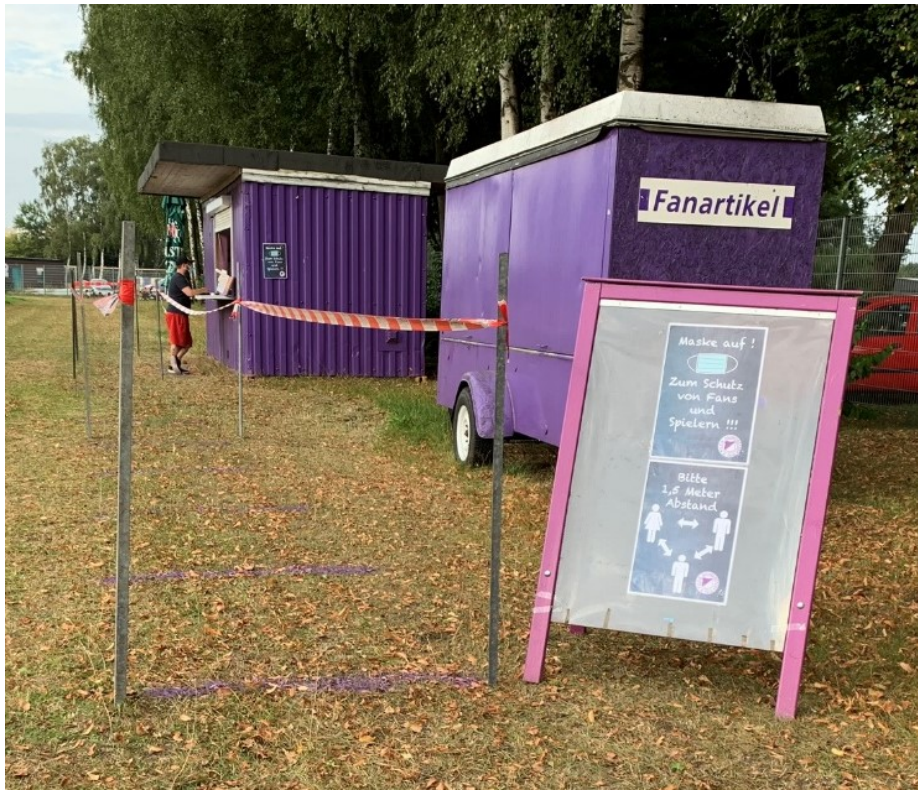
Abbildung 3: Hinweise am Eingang zum Verkaufsstand