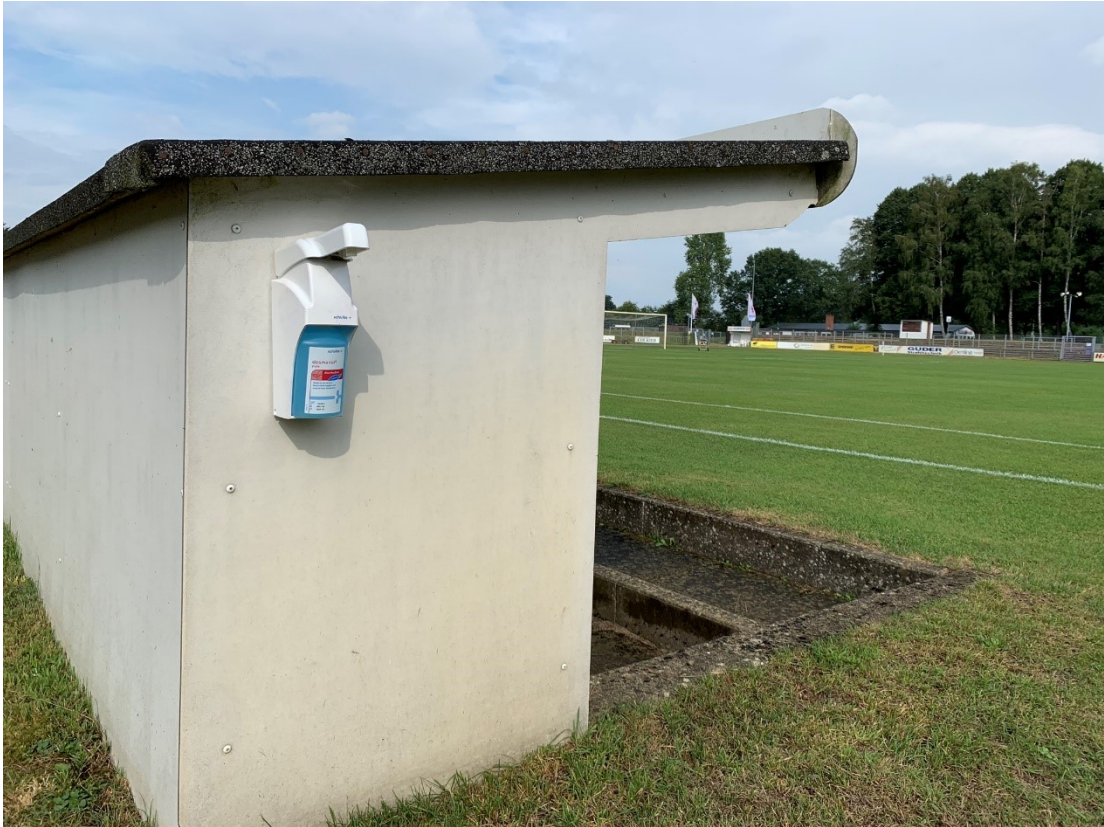
Abbildung 1: Hygienestation je Coachingzone