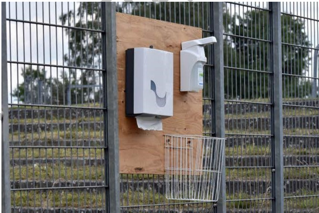
Abbildung 2: Hygienestation zwischen Zone 1 und 2