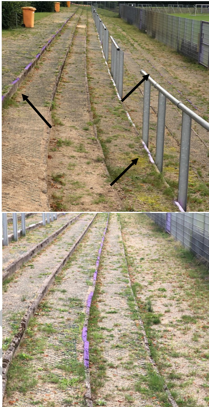
Abbildung 4: Bodenmarkierungen der einzelnen Plätze (1,50m Breit)